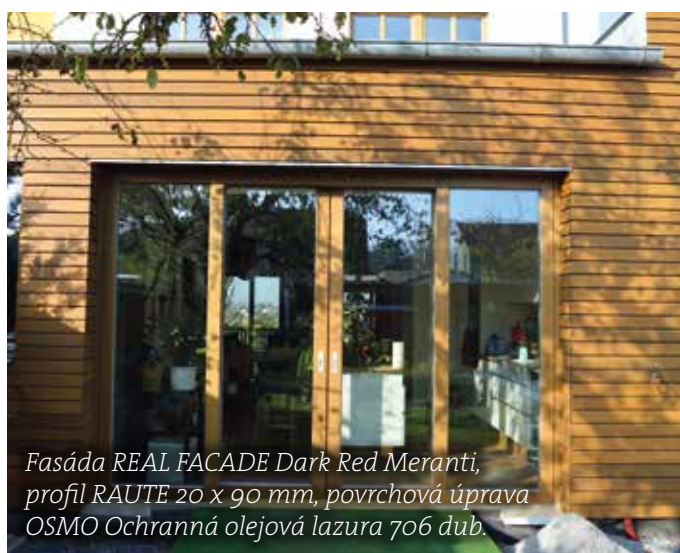
Fasáda REAL FACADE Dark Red Meranti, profil RAUTE 20 x 90 mm, povrchová úprava OSMO Ochranná olejová lazura 706 dub.