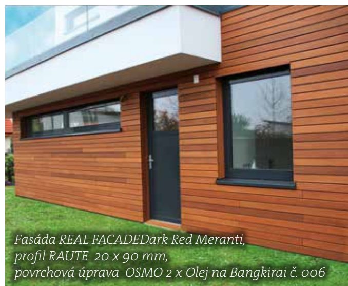
Fasáda REAL FACADE Dark Red Meranti, profil RAUTE 20 x 90 mm, povrchová úprava OSMO 2 x Olej na Bangkirai č. 006