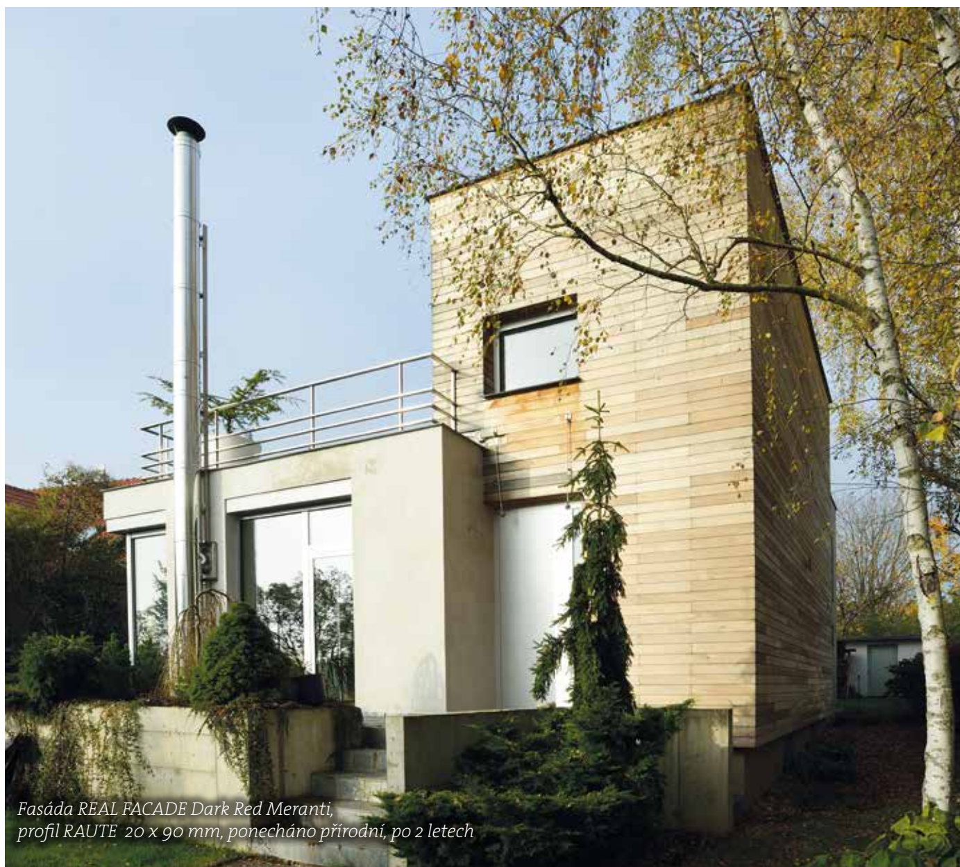
Fasáda REAL FACADE Dark Red Meranti, profil RAUTE 20 x 90 mm, ponecháno přírodní, po 2 letech