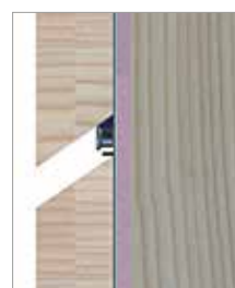
Vzdálenost spáry se automaticky nastaví hlavou profilového vrutu, hotovo!