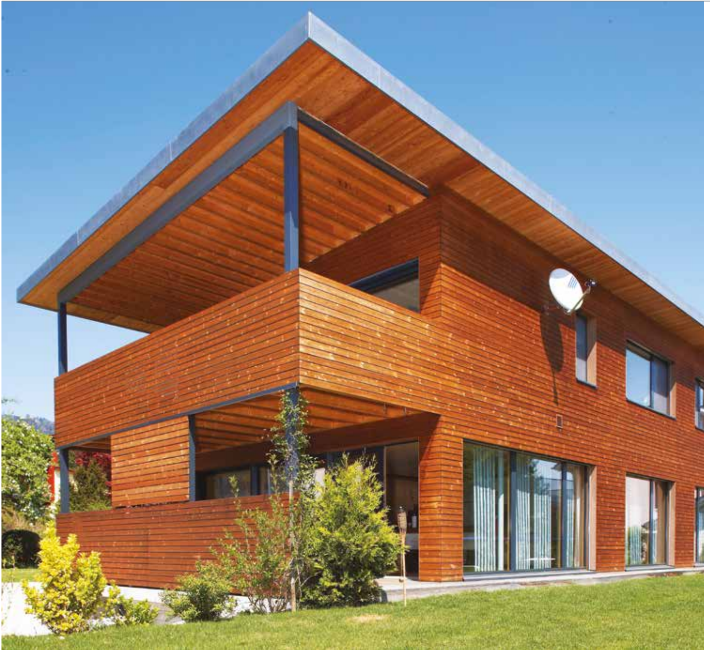
Fasáda REAL FACADE, Thermo borovice 26 x 92 mm, ponecháno přírodní