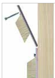
Další profil jednoduše zasuňte a pouze na horní straně přišroubujte profilovým vrutem.