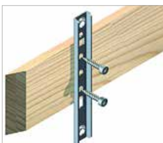
Klip na fasády přiložte zářádkou na zadní straně a zašroubujte profilový vrut.