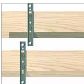
Postup opakujte při osazování veškerých dalších fasádních profilů.