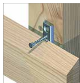
Fasádní profil přišroubujte ke kontra latě.